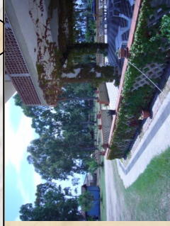
La struttura centrale del campeggio