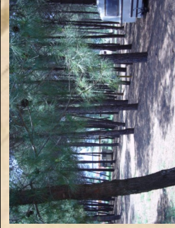
Uno scorcio della nostra pineta