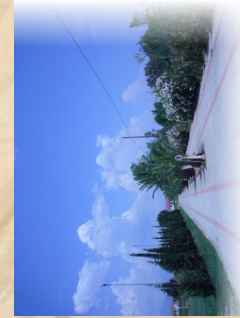
L'ingresso del Campeggio