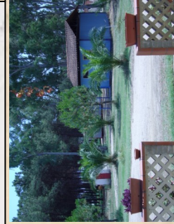
Uno dei bungalow, immerso nel verde